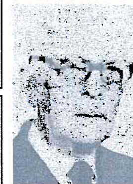
D. Francisco Vales Villamarín

Profesor e historiador, naceu en Betanzos o 7 de maio de 1891 (24 de agosto de 1982). Publicou unha treintena de obras relacionadas coa súa cidade natal.