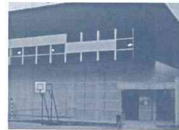
Pabellón Deportivo Vales Villamarín.

En estreita colaboración coa agrupación deportiva do colexio, conseguíuse a reparación de goteiras, e doutros desperfectos, así como a próxima colocación por parte do concello, dunha cortina que nos permita dividir a pista, para poder facer varias actividades ao mesmo tempo.