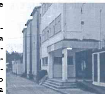
Colexio Fco.Vales Villamarín (Betanzos)

Os contidos serán unha mestura de información e opinión, exclusivamente acerca do día a día do colexio. Non publicaremos nin opinións políticas nin calquera artigo que poida ferir a sensibilidade de laguen. Isto non é óbice para facer calquera tipo de crítica. Sen máis, aproveitamos para facervos chegar a todos e cada un dos que leades esta pequena editorial o noso saúdo máis agarimoso.