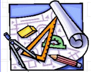
(F2) Redacción Proxecto