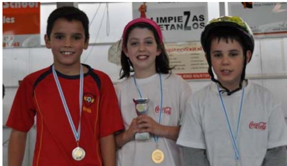
Imaxe correspondente á 8ª Torneo, celebrado no 2010

As modalidades nas que poderá participar son: baloncesto, fútbol sala, bádminton, tenis de mesa e atletismo.