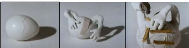
Imaxe vídeo amosado na presentación

Toma de decisións, autonomía persoal, dependencia familiar, sobreprotección, habilidades sociais, serán algúns dos temas que irán saíndo en futuras xornadas. O noso consello é que non as perdades.