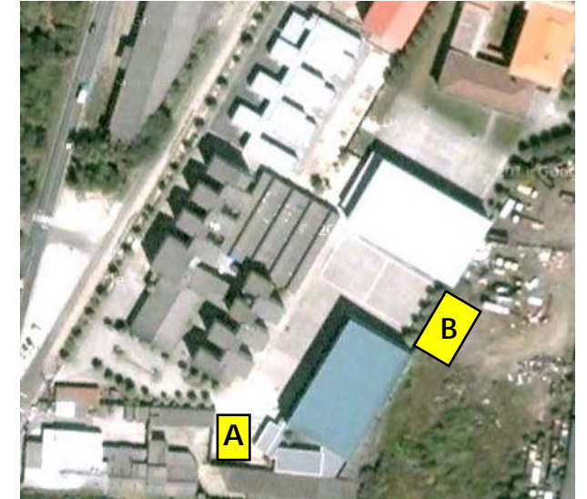
Plano ubicación colexio: ubicación dos barracóns

A situación do COLEXIO NOVO DE INFANTIL foi o outro tema tratado. Pouca información deu o responsable da Consellería de Educación, máis alá de que o proxecto está en marcha e non ten volta atrás. Todo bastante inconcreto e certamente difuso.