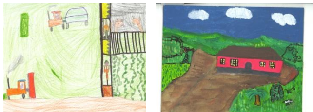
Pinturas participantes no concurso Fertiberia 2012

Despois do prazo de presentación dos traballos, recibimos un total de 53 debuxos e pinturas que xa foron enviados ó concurso. Unha copia dos mesmos está exposta no blog e no taboleiro da ANPA na porta do colexio. Na festa do Nadal procederase á entrega dos premios ós mellores de cada ciclo e dun agasallo a tódolos participantes.