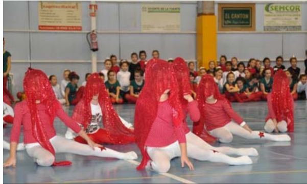
Exhibición de Ximnasia Rítmica