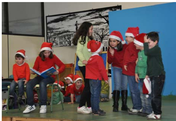
Mini-obra de Teatro