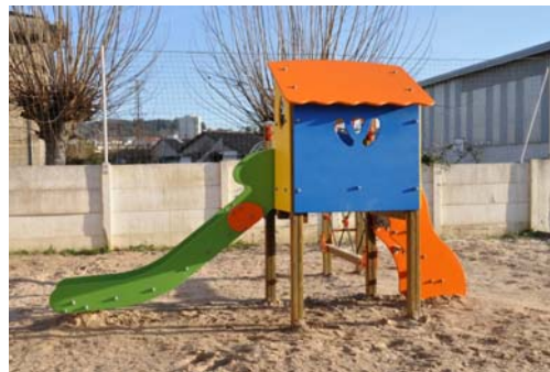
Material reposto polo Concello na zona de infantil