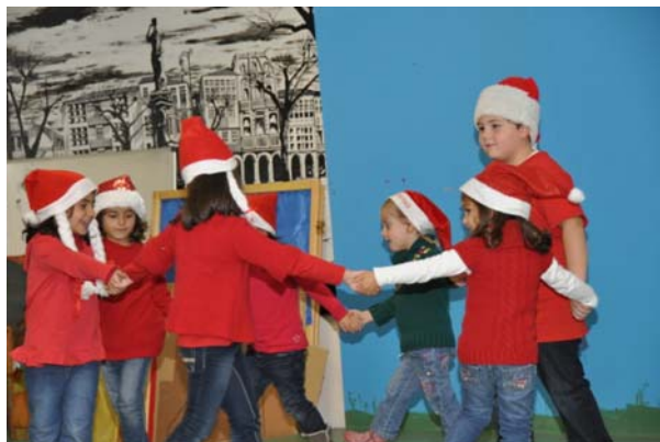
Exhibición de Baile