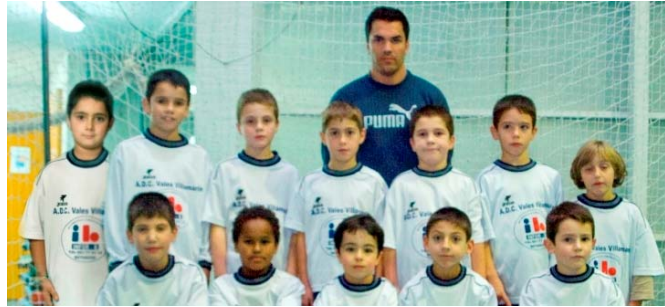
Equipo de Fútbol Sala: 7-9 anos