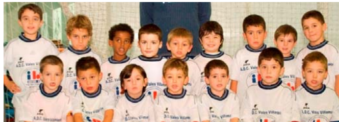
Equipo de Fútbol Sala: 4-6 anos

Desenvolver as habilidades motrices básicas, coñecer novos compañeiros/as e relacionarse con eles/as como medio de desinhibición persoal, valorar o esforzo e a colaboración por encima do resultado, participar en competicións como medio de disfrute persoal, sen pensar no resultado final, son parte dos obxectivos irrenunciabes desta agrupación.