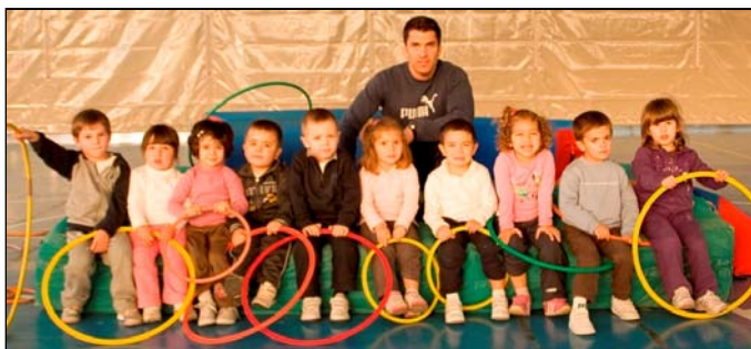
Grupo de Psicomotricidade