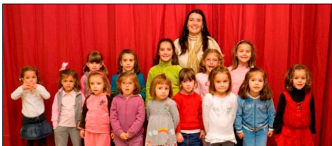
Grupo de Baile

Tamén conseguimos, con elas, chegar ao colectivo das nenas a aos dos máis pequenos; de feito, en psicomotricidade contamos con 6 nenas e 5 nenos e en baile con 14 nenas, a maioría de 3 a 6 anos.