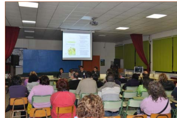
Imaxe da asemblea celebrada o 22 de outubro

Remata o prazo para facerse socio/a da ANPA Brigantium data límite: 15 de novembro